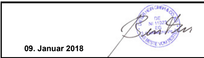
Datum, Unterschrift, Stempel